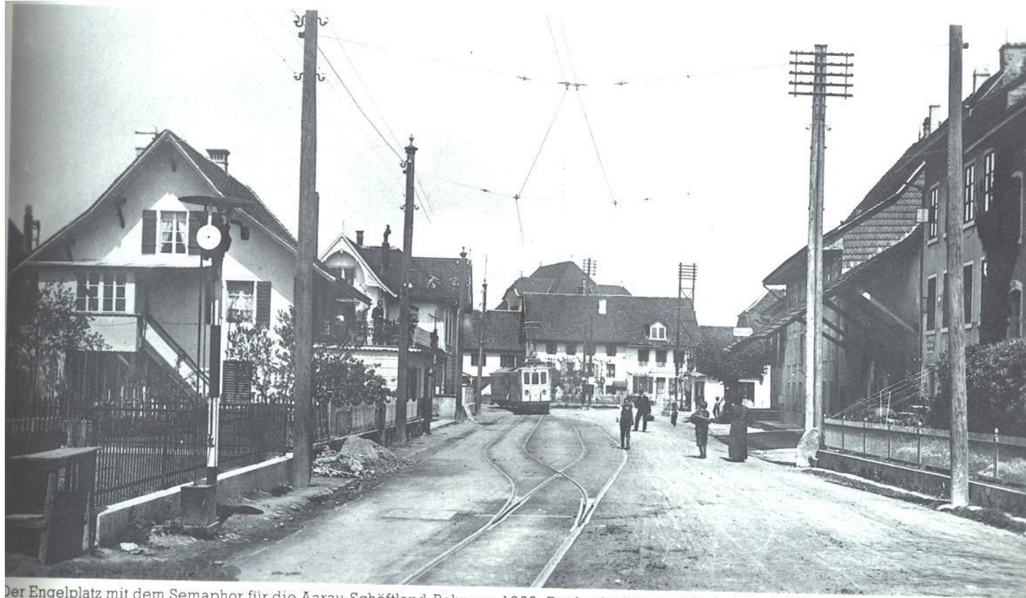
Der Engelplatz mit dem Semaphor für die Aarau-Schöftland-Bahn um 1920. Rechts befinden sich der Gasthof Engel und die Post.