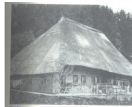
Vor 1957 Guldihaus Parzelle 470