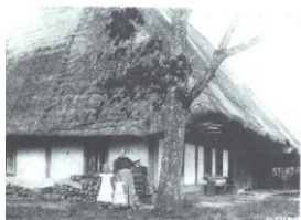
Bau Deutmann am Rütliweg