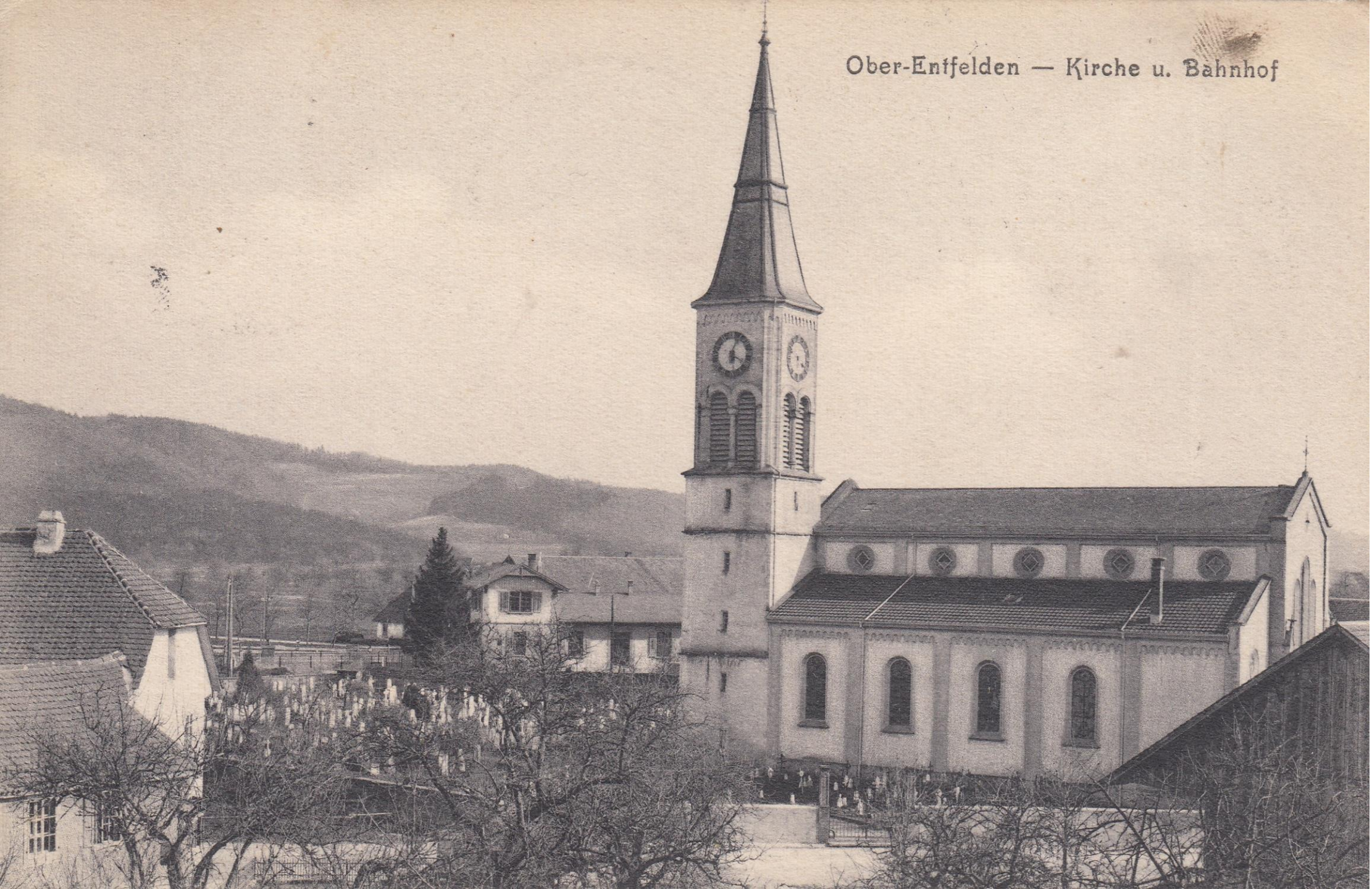
Ober-Entfelden — Kirche u. Bahnhof