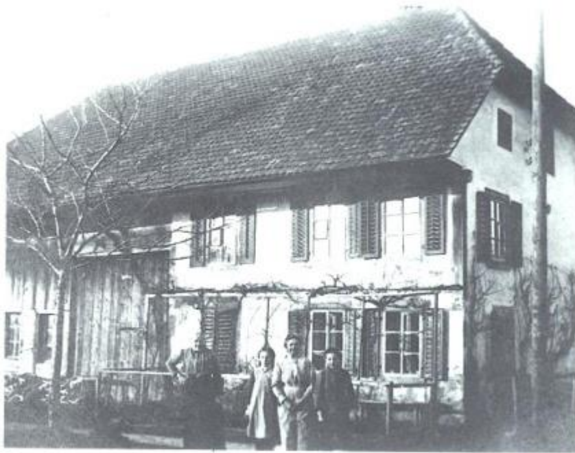
Haus Fischer hinter dem Bahnhof, vor 1931.

Theil gewikeltes, zweistöckiges Haus samt Scheunwerk, mit Tränkeller und Ziegeldach Neubau 1932